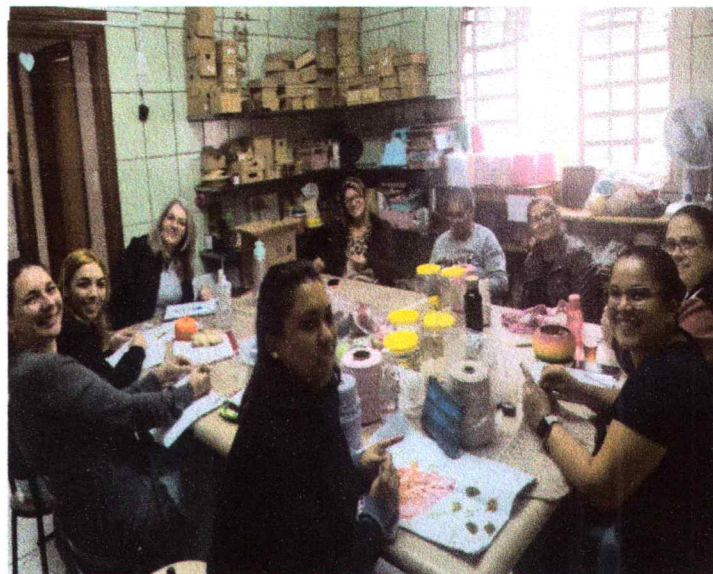
Crochê – turma de quinta-feira