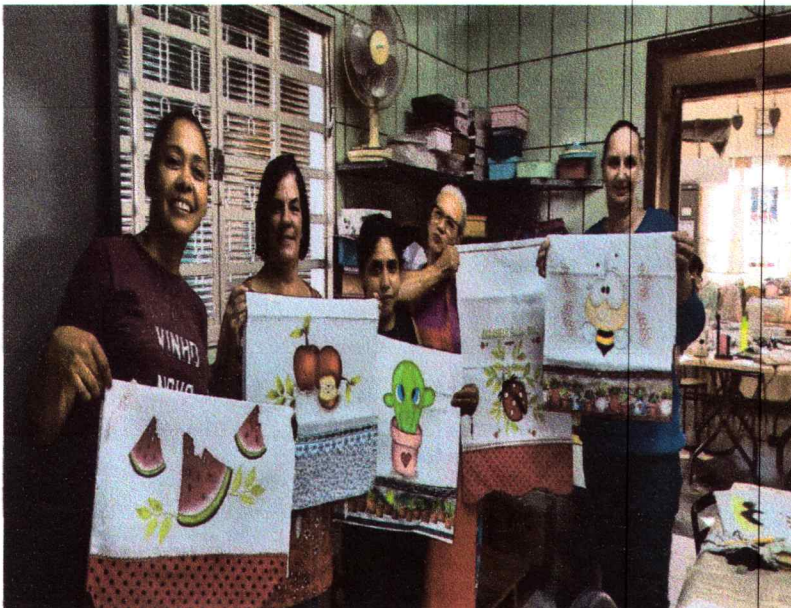
Pintura em tecido