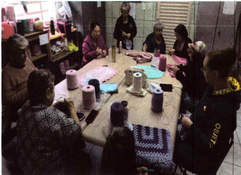
Crochê – turma de quarta-feira